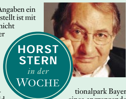
HORST STERN in der WOCHE

Horst Stern über eine neue Studie zu Schutz und Nutzung des DEUTSCHEN WALDES